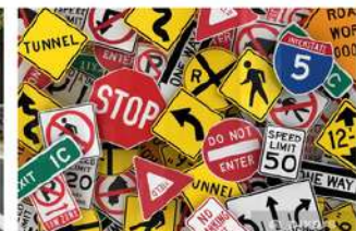
Road Safety in Italy: Regulations and Challenges